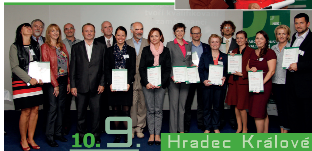
10.9. Hradec Králové