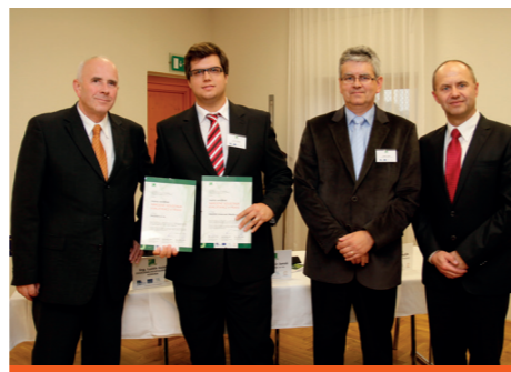
Ocenění si z rukou představitelů SP ČR, HK ČR a společnosti TREXIMA převzalo 25 společností.

Jak využíváte NSK ve své společnosti? Jsme se ptali zástupců oceňovaných firem.